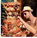
By Marcel, work in progress