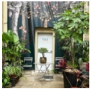
Le Jardin en pots du Logoscope