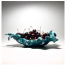
By Marcel, work in progress / DR Yannick Cosso-Le Logoscope