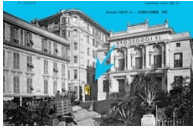
Ateliers du Logoscope-Ancien bâtiment du crédit lyonnais